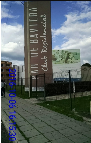
FOTOGRAFIA 2: vista del Elemento tipo valla de obra instalado en el predio ubicado en la Carrera 52 A No 175 – 66 (sentido S-N)