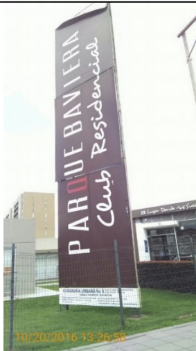
FOTOGRAFIA 1: vista del Elemento tipo valla de obra instalado en el predio ubicado en la Carrera 52 A No 175 – 66 (sentido N-S)