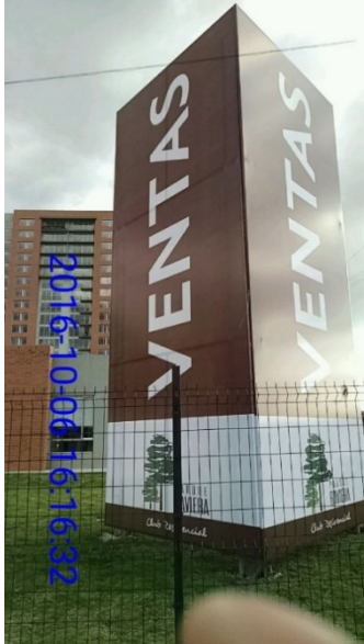
FOTOGRAFIA 4: vista del Elemento tipo valla de obra instalado en el predio ubicado en la Carrera 52 A No 175 – 66 (sentido E-O)