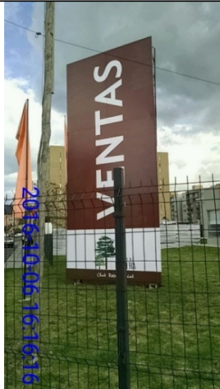
FOTOGRAFIA 3: vista del Elemento tipo valla de obra instalado en el predio ubicado en la Carrera 52 A No 175 – 66 (sentido O-E)